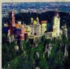
Sintra é património da Humanidade.

▶ Castelo de fundação muçulmana. Fica a 3,5 km do centro histórico, na Estrada da Pena. Autocarro 434, com partida da Estação de Sintra.